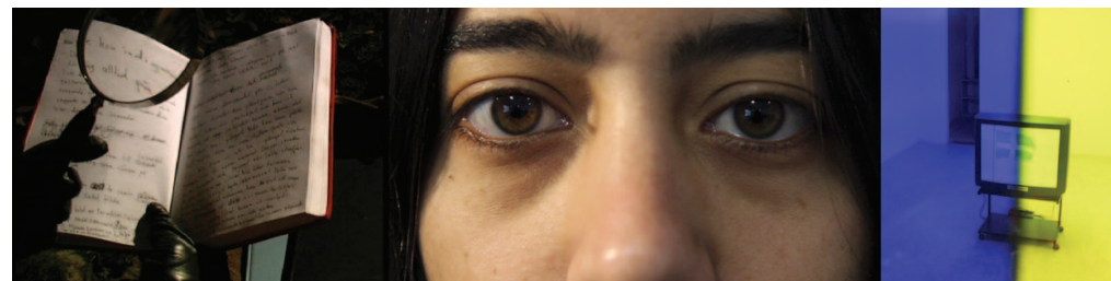
Fönsterlösa utsikter. Att bära post genom vinterdvala av Barkman | Home av Oscar Lara | 3D-flagga av Christian Partos

– ett konstprojekt om hembygd och identitet